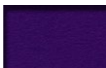
Pourpre 8D2 / 1147