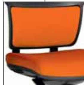
Nouvelle assise tissu