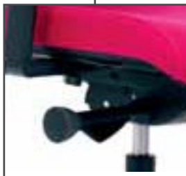
Mécanisme auto-flex plus