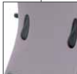
Renfort lombaire réglable