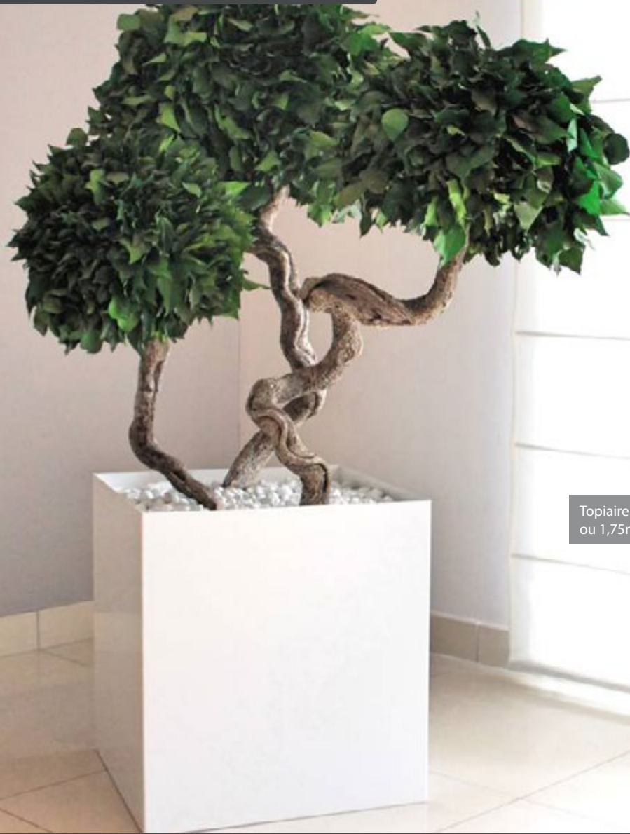
Topiaire 3 têtes coloris vert H.1,85 ou 1,75m avec bac blanc 50/50cm