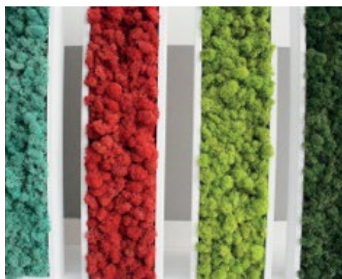
Série 4 cadres lichen 15/40cm CVL15/40CM 255€