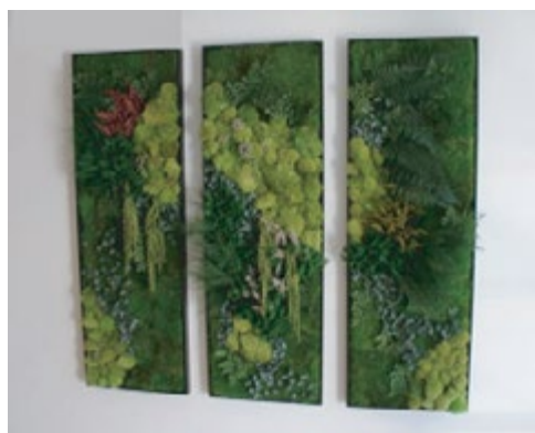
Tryptique multi-végétal 30/70cm CTV30/70 550€