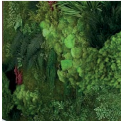
Mur multi - végétaux MMV100 500€