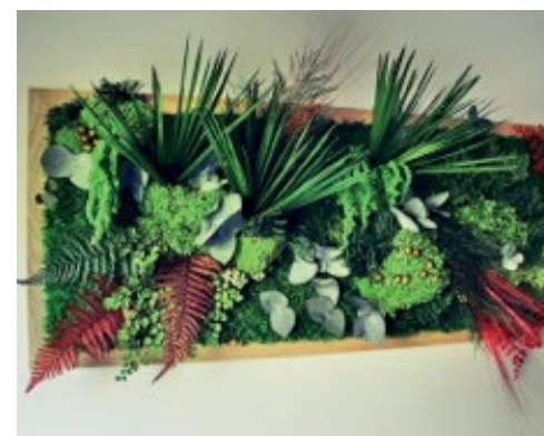
Cadre rectangle 40/80cm multi-végétal CVM40/80 280€

Encadrement bois blanc 4cm d'épaisseur. D'autres tailles sont disponibles sur demande uniquement.