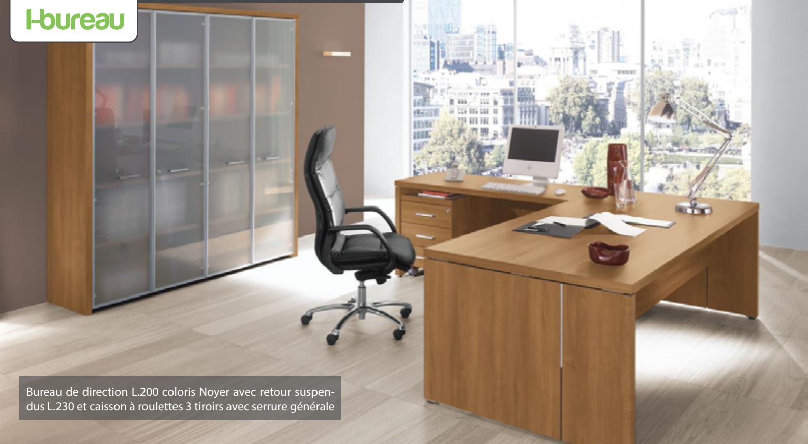
Bureau de direction L.200 coloris Noyer avec retour suspendu L.230 et caisson à roulettes 3 tiroirs avec serrure générale