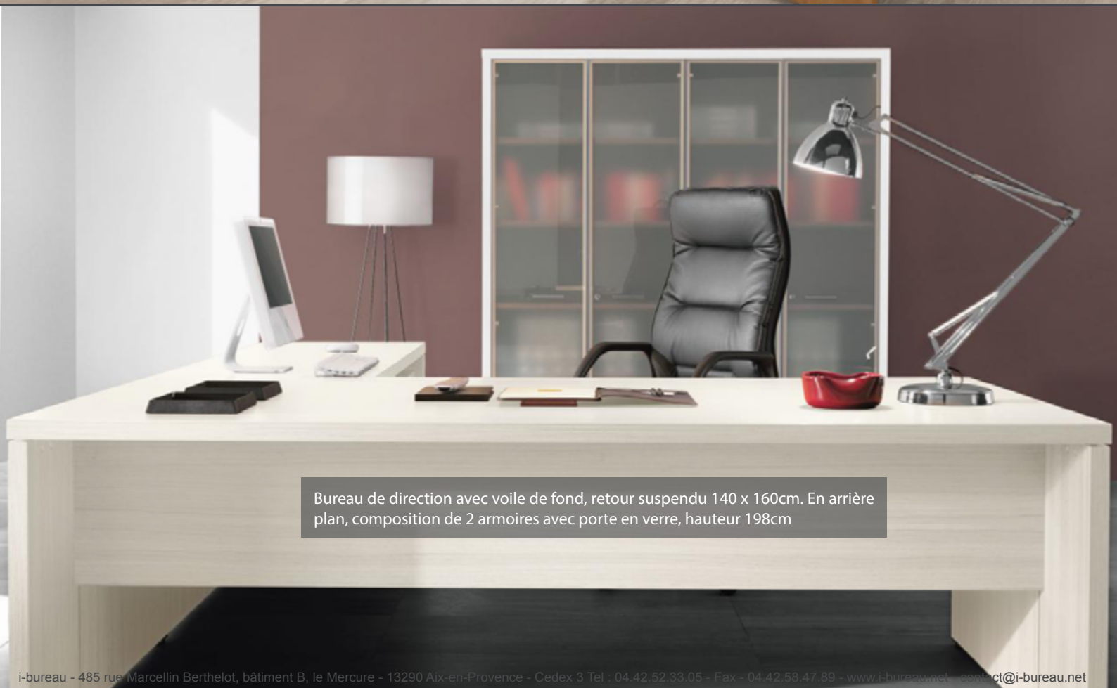
Bureau de direction avec voile de fond, retour suspendu 140 x 160cm. En arrière plan, composition de 2 armoires avec porte en verre, hauteur 198cm